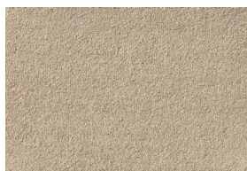
DINA T 101