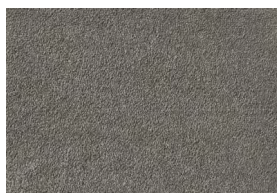
DINA T 103