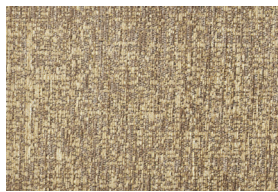
ARISA T 202