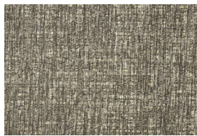
ARISA T 203